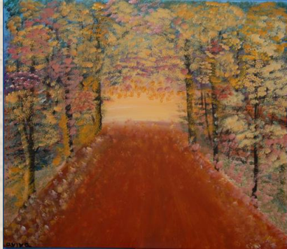
אור בקצה המנהרה – Avivart

הצלחות מרשימות של דיסלקטים מחד ומחקרי מוח מתקדמים מאידך גרמו לתפנית מרשימה בהבנת הדיסלקציה. בלי להתעלם מהקשיים, הזרקורים הופנו אל היכולות המיוחדות שמתלוות לתופעת הדיסלקציה.